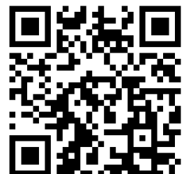
OSCVPass Github Project